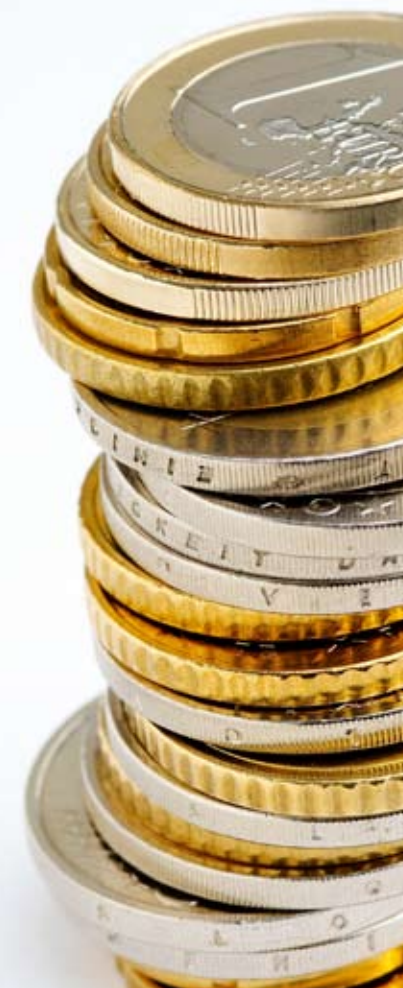
La France risque une amende de 11 millions d'euros si elle ne respecte pas les normes sur les particules fines (PM10) d'ici 2014

J-B R.: Déterminer un seuil en dessous duquel on ne risquerait rien n'est pas chose aisée. La plupart des seuils sont établis de manière « empirique », à partir d'études médicales de toxicité.